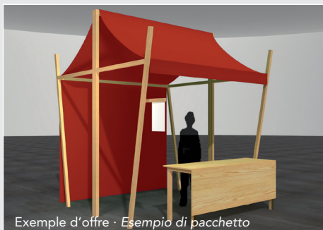
Exemple d'offre · Esempio di pacchetto