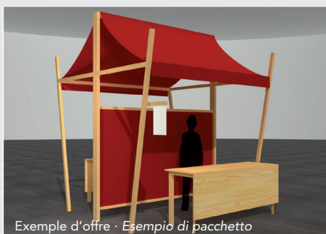
Exemple d'offre · Esempio di pacchetto

Noi progettiamo e organizziamo il Vostro stand fieristico occupandoci al tempo stesso del tempestivo montaggio e smontaggio. Vi preghiamo di ordinare il pacchetto desiderato tramite modulo di iscrizione.