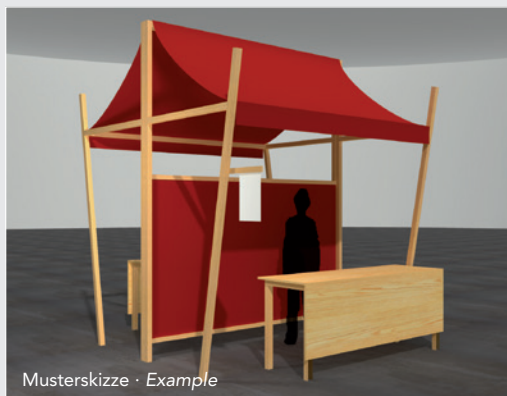
Musterskizze · Example

We will plan and organise your trade fair stand and ensure set-up and dismantling are carried out in time. Please order the required stand construction package with the application form.