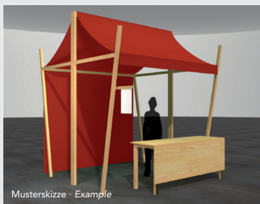
Musterskizze · Example